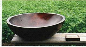
日本一? 大きいかもしれない 手づくりこね鉢(直径32cm、高さ30cm)